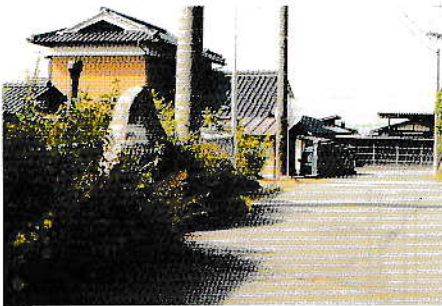
母子健康センターの跡地