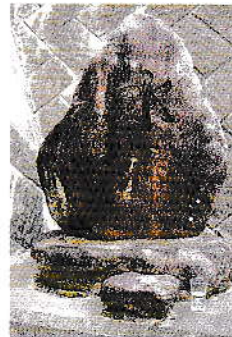
② 八十二銀行駐車場奥 昭和22年(1947)