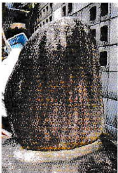
④ 昭通貯水槽横 昭和6年(1913)

この「水神」は県道バイパスの跨線橋の下、線路沿いの道路端、下伊那厚生病院のフェンスの中にある。建立は昭和37年(1962)で「三六水害」の翌年である。 かつて天竜社の敷地だった所で、再びこのような大きな水害がおこらないように、神に祈って建てられたものである。