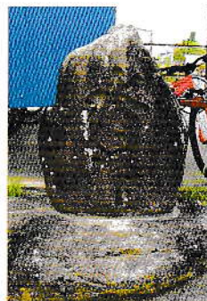
③ 市田駅前広場 大正14年(1925)