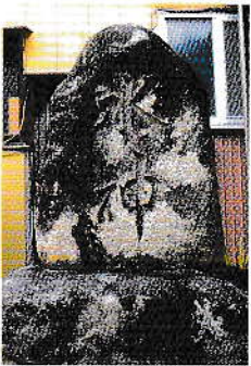
⑤ 川端通貯水槽横 昭和10年(1935)