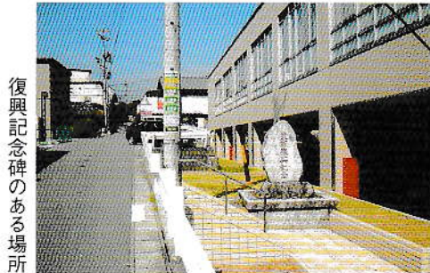
復興記念碑のある場所