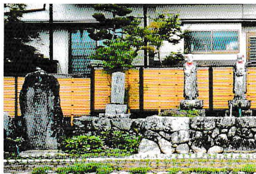
供養塔のある近景