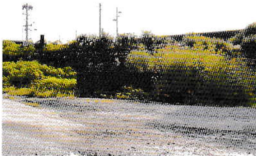
取り入れ口の遠景