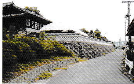
護摩堂と言面金剛遠景