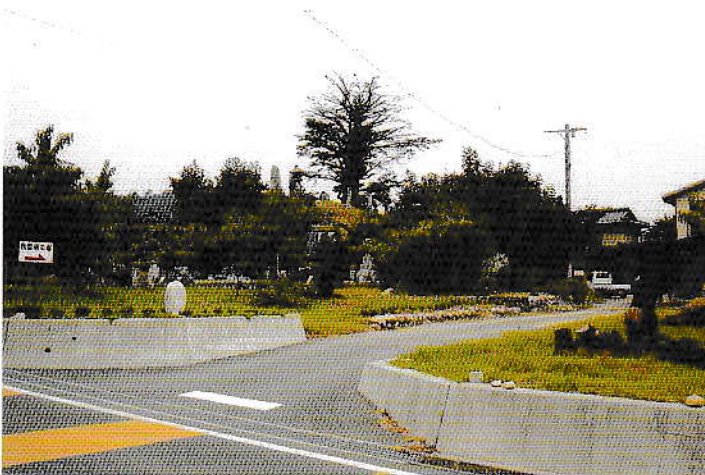
武陵地第一号古墳の遠景