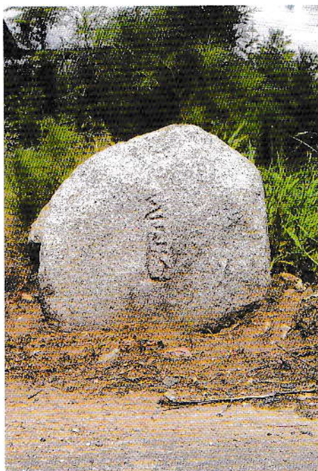
右ぜんかうじの道標