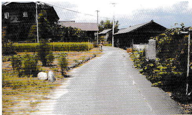
廻国巡礼塔・道祖神の碑のある風景